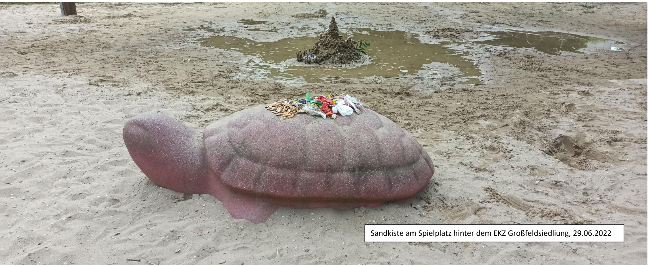
Sandkiste am Spielplatz hinter dem EKZ Großfeldsiedlung, 29.06.2022

25. Allgemeines Rauchverbot entlang Wiener Gewässer, auch vor oder in den dort angesiedelten Gaststätten.